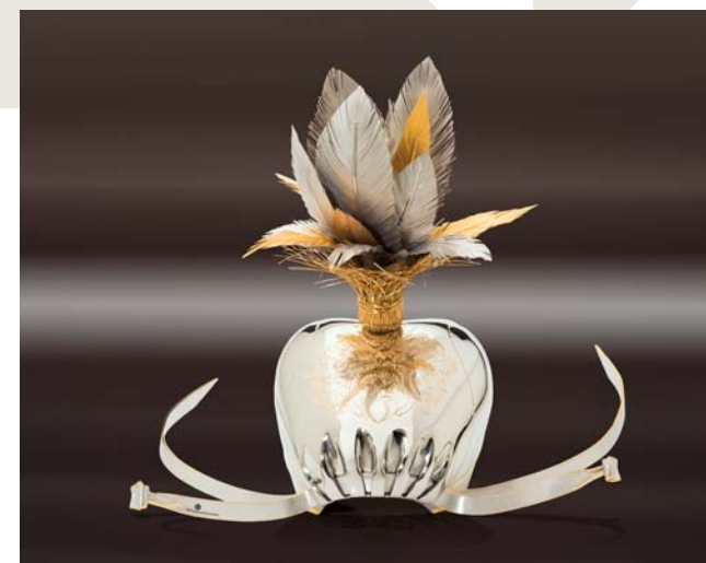
Kunstobjekt: Falkenhaube komplett aus Silber. Ist zum Verhauben nicht geeignet.