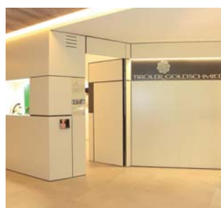
Tiroler Goldschmied im Sport & Wellness Resort Quellenhof St. Martin in Passeier, 2013