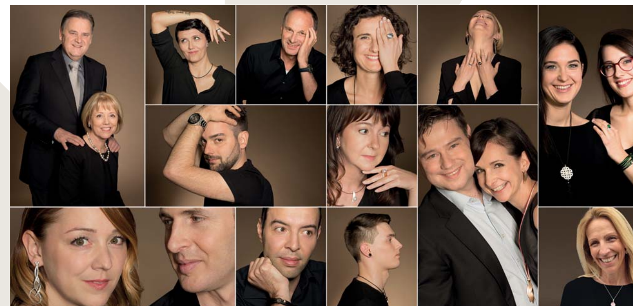
Das 18-köpfige Tiroler Goldschmied Team