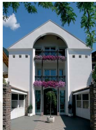
Tiroler Goldschmied Hauptsitz Dorf Tirol, 1988

Der Tiroler Goldschmied hat vier eigene Kollektionen entwickelt: Die jährliche LA PREZIOSA Design-Schmuck-Kollektion, die Trauschmuck-Linie, die exklusive „Haute Jewellery“ Linie und die Tiroler Goldschmied „Tracht- & Jagdschmuck“-Linie. Diese wurden auf diversen Messen in Salzburg, Dortmund, München, Seefeld und Bozen präsentiert. Im Herbst 2010 wurden zum ersten mal die diamantenbesetzten Falkenhauben in Abu Dhabi auf der größten Falkenmesse mit aussergewöhnlichen Erfolg ausgestellt. Diese Weltneuheit hat bei der internationalen Presse großes Aufsehen erregt. Selbstverständlich werden in den Geschäften weiterhin auch die Kollektionen internationaler Schmuckhersteller, Uhren führender Manufakturen und junges Design angeboten. Kreativ und zeitgemäß präsentieren sich auch die Geschäfte, ästhetisch und funktionell durchdacht – ganz den wertvollen Objekten, aber auch dem beruflichen und privaten Selbstverständnis der Familie Gamper entsprechend.