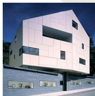
Tiroler Goldschmied Filiale Schenna, 2006