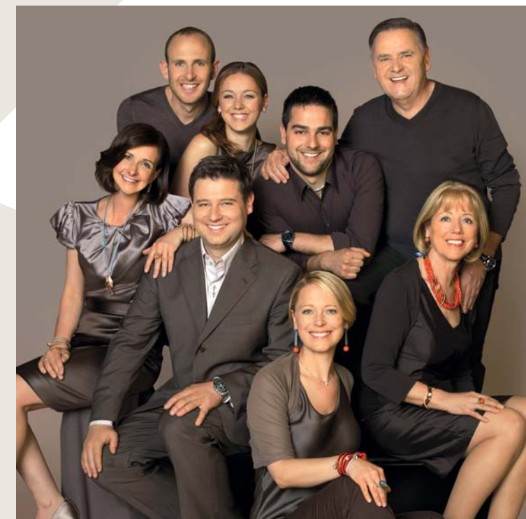
Tiroler Goldschmied Die Familie mit gemeinsamer Freude am Beruf.